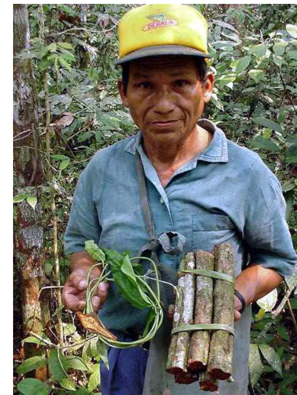
Coltivatore di AYAHUASCA

"Usate gli aerei A-37. Bombardate e mitragliate tutti questi aeroporti e impianti di lavorazione [...]" queste parole sembrano quelle di un generale dell'esercito più che di un capo di stato. Eppure queste sono proprio le parole del presidente Alan Garcia che ha ordinato raid aerei contro i narcotrafficanti della regione amazzonica peruviana. (Fonte ASCA, agenzia stampa quotidiana nazionale del 02/04/2007). Ancora una volta, come nel precedente numero del giornalino, le notizie che riguardano la politica interna del Perù sono agghiaccianti e lasciano presagire vacillanti equilibri all'interno del paese. Certo il commercio di droga in Perù, come in tutto il Sud America, è un problema endemico, che annovera tra le sue ragioni d'essere numerose cause e concause: possibilità di guadagni in paesi afflitti dalla povertà che vedono in questo commercio un via percorribile; lasciapassare dei governi locali; i consumi, in crescente aumento, di sostanze stupefacenti nei paesi occidentali ma a voi lettori le considerazioni se tale questione si può affrontare con l'uso della forza che colpisce non solo gli aeroporti e gli impianti di lavorazione, ma anche villaggi e civili, perché fino a prova contraria non ci sono bombe intelligenti.... R. B